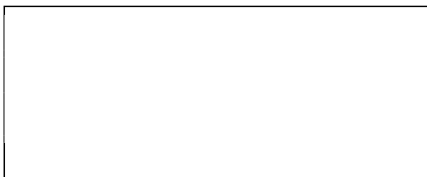
Схема границ эксплуатационной ответственности сторон

Прочие сведения по установлению границ раздела эксплуатационной ответственности сторон _____